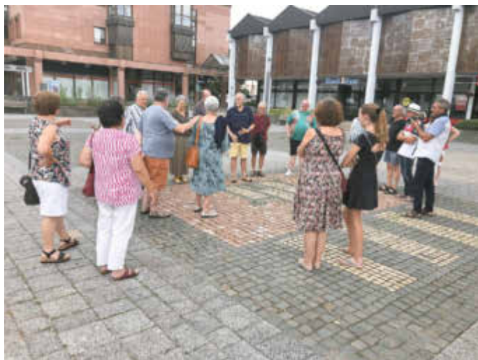
Gäste und Gastgeber am Wappen von Montmorillon

Anlässlich des Lampionfestes am Noswendeler See weilte kürzlich eine achtköpfige Delegation aus unserer französischen Partnerstadt Montmorillon auf Einladung des Partnerschaftskomitees in Wadern und Noswendel. Während des Besuches stand außer dem geselligen Austausch über gemeinsame Erinnerungen die Auffrischung der seit 55 Jahren bestehenden partnerschaftlichen Verbindung im Mittelpunkt.