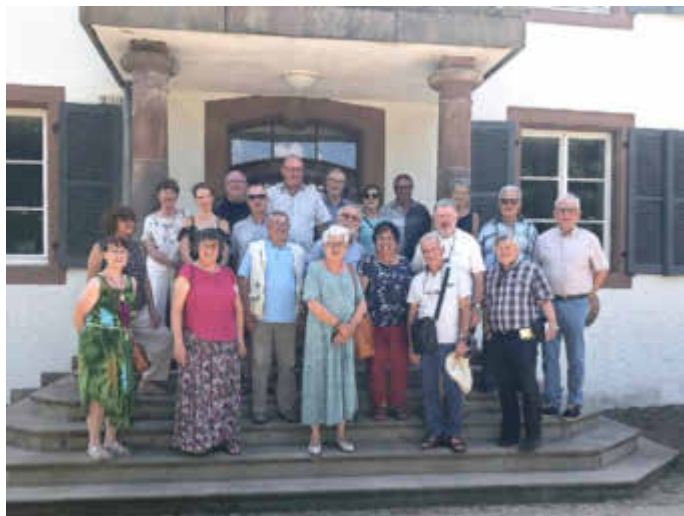
Gruppenbild auf Schloss Dagstuhl