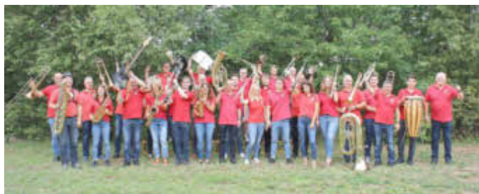
...und die BigBand Buweiler

zusammen auf dem Marktplatz bei einem erfrischenden Getränk der Marktwirte einen schönen lauschigen Sommerabend zu verbringen – eine gute Gelegenheit für Musikliebhaber, ihre lokalen Musikvereine zu unterstützen und einen Abend mit herausragenden Darbietungen in der malerischen Kulisse von Wadern zu genießen.