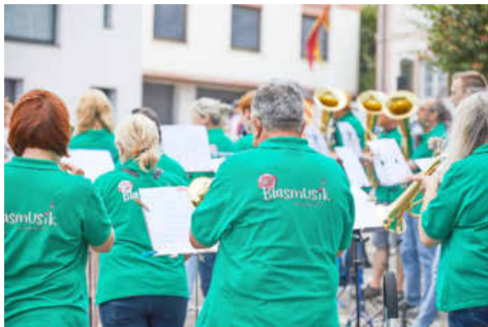
Mit dabei: Der MV Bardenbach-Noswendel...

Seit vielen Jahren arbeiten die Musikvereine eng zusammen, organisieren Konzerte, Jugendfahrten und betreiben ein Jugendorchester. Dieses harmonische Miteinander besteht bereits seit über 40 Jahren. Da die Jubiläumsfeier leider in die Pandemiezeit fiel, wird jetzt alles doppelt und dreifach nachgeholt.